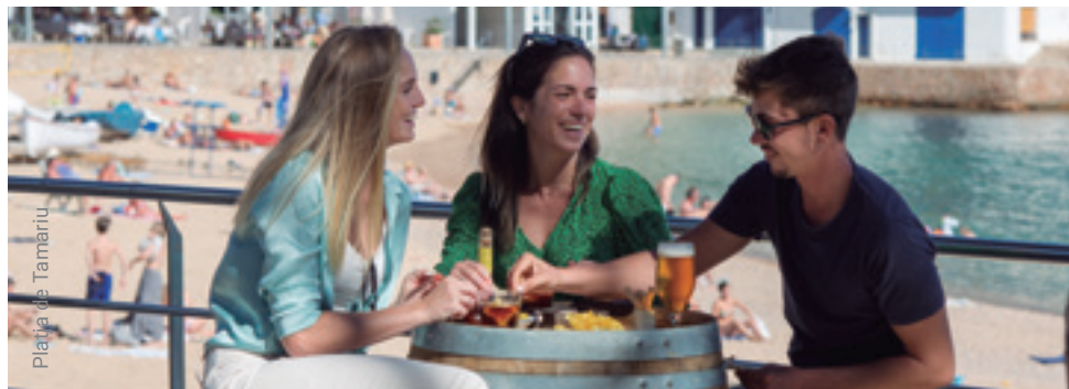
Platja de Tamaríu

Stollí's Divebase | Pg. del Mar, 26 | 972 62 00 35 | stollis-divebase.eu